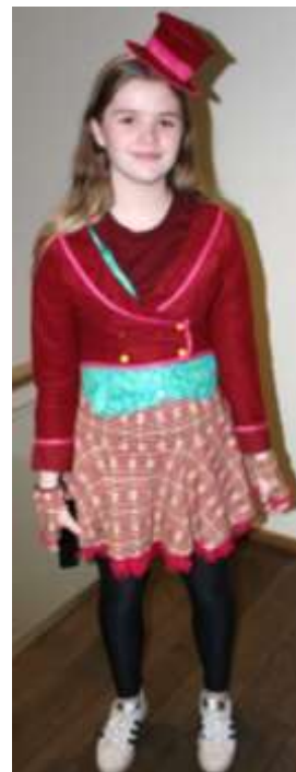
The Mad Hatter