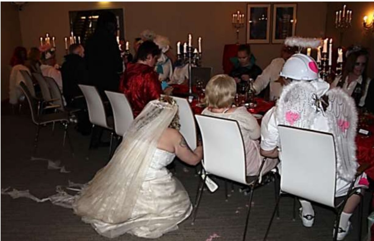
Den forsmådde brud