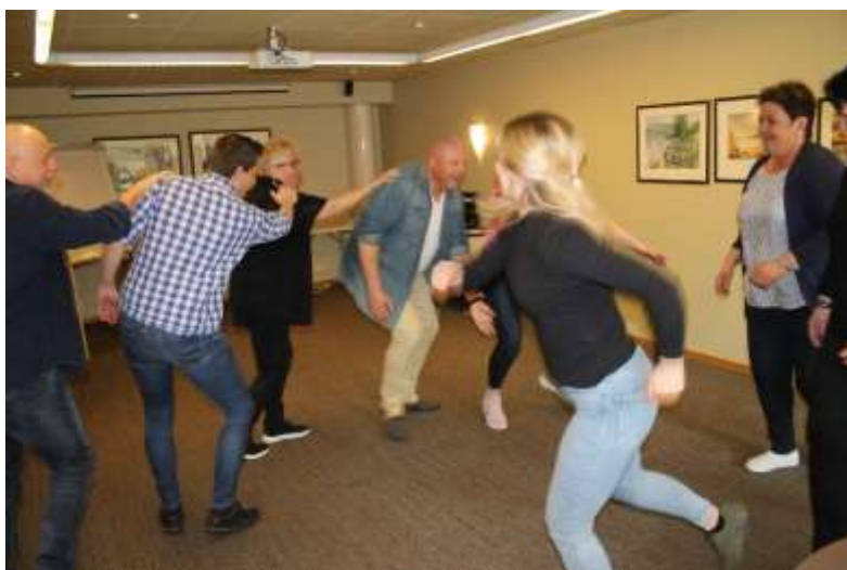
Bli kjent oppvarming må til.