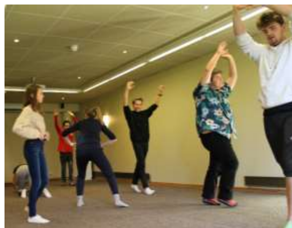
Mye bevegelse på Kurset i Skuespillerteknikk.