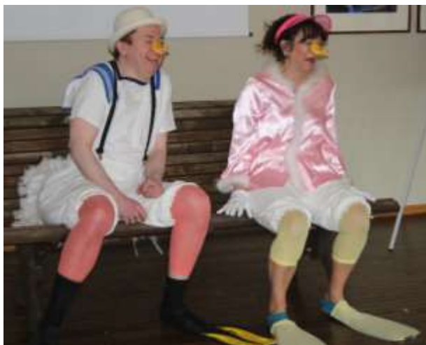
Sladder i Andedammen

Søndag var det videre kursing og så fremføring av de ulike tolkningene av de utdelte tekstene, mye lått og løye.