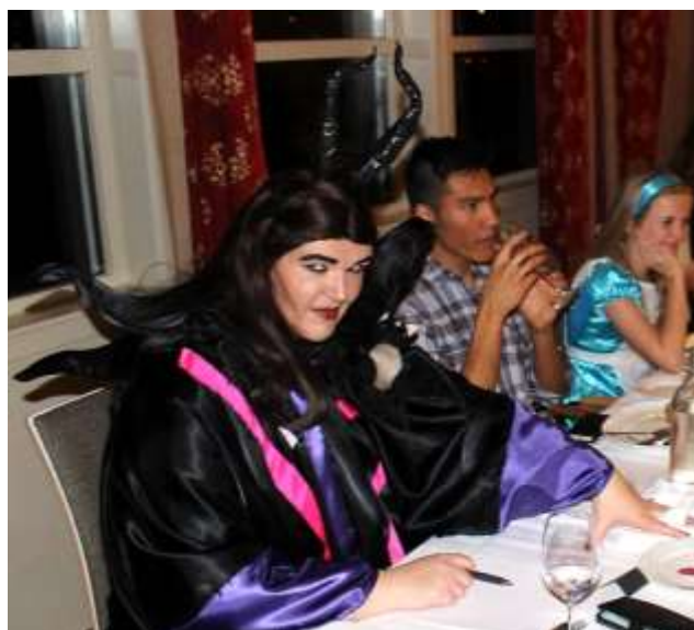
Den onde stemor Malefika, en Dverg og Alice