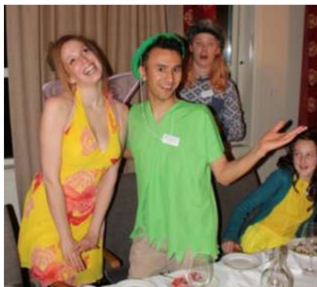
Tingeling valgte etter MYE om og men å forlove seg med Peter Pan. Kristoff og Belle er sjokkert!