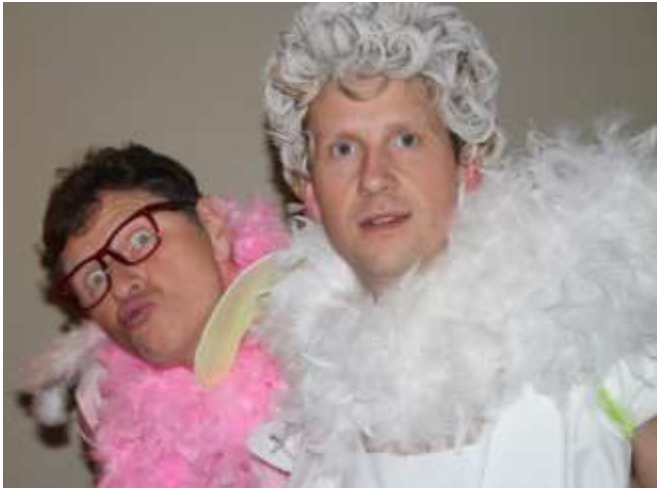
To søte engler