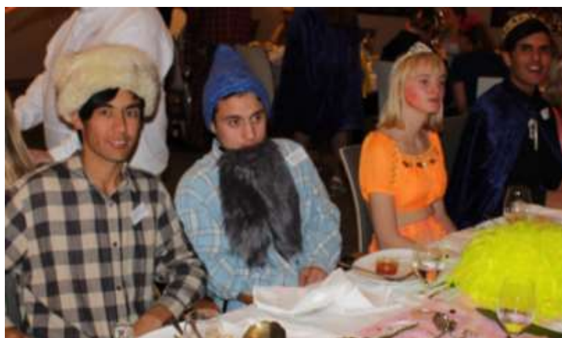
Her er to Dverger sammen med Attina og Prins William