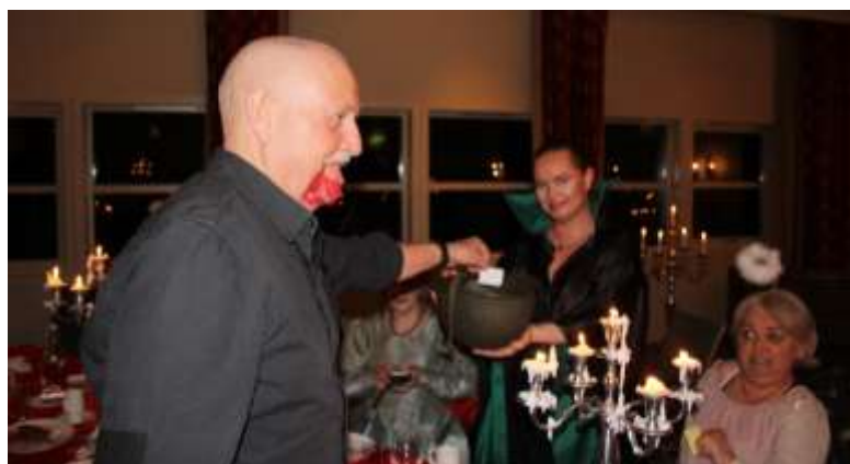
Innsamling av stemmer til beste kostyme.