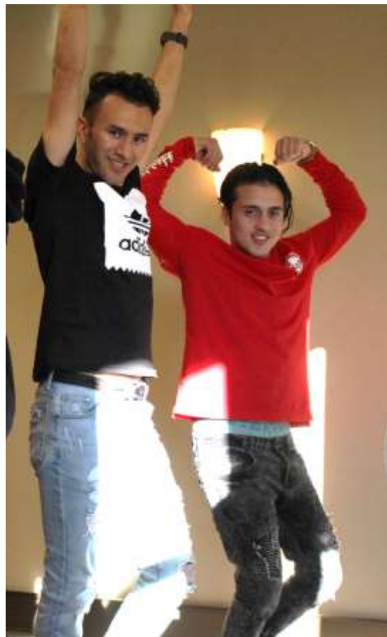
Glade gutter på Skuespillerteknikk.