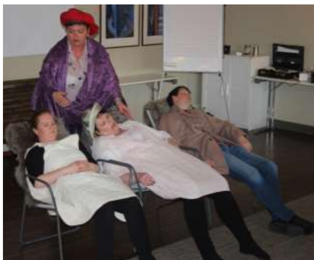
Futt og fart på Aldershjemmet