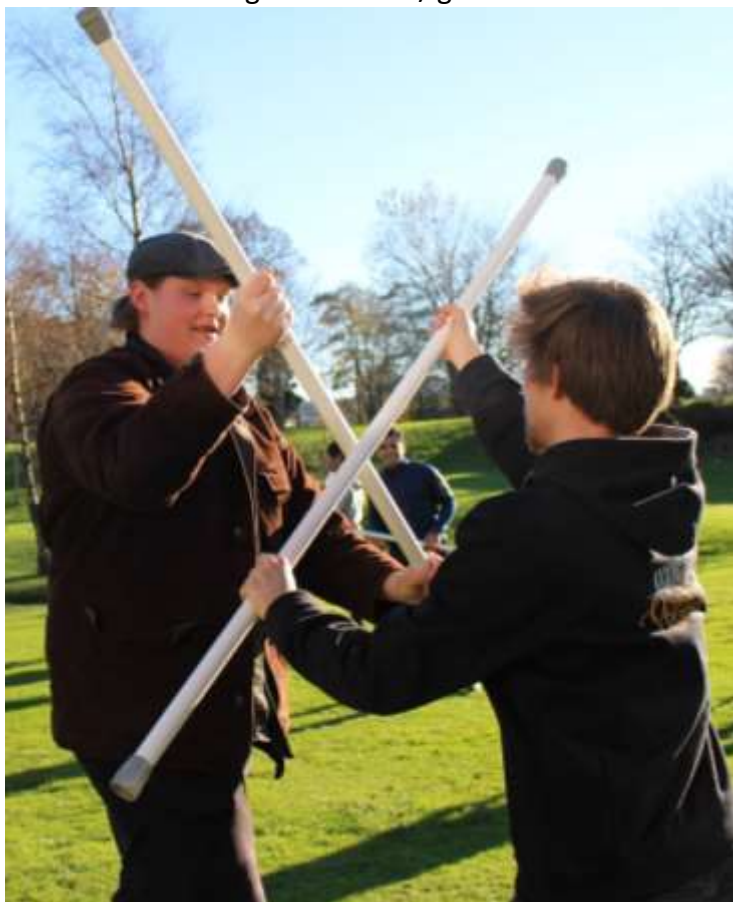
Scenekamp hadde også øving ute på plenen i det fine høstværet.