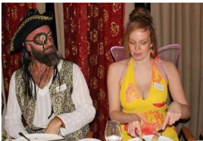
Kaptein Krok ønsker å fortelle at han er forlovet med Tingeling